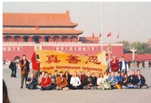
■ 三十五名西人法轮功学员去北京天安门证实大法、抗议迫害

通过我这张西方的面孔和纯净的心，能够唤醒你们心中的善念。请不要追随江泽民及其帮凶迫害法轮功，因为这会使你们陷入灾难。我不反对中国政府，也不反对中国。实际上，自从修炼法轮功以来，我已对中国文化和中国人民有了更深的理解。这也是我觉得我必须去中国的原因。