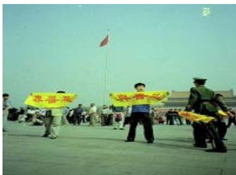
■ 天安门前和平上访的法轮功学员

其中部份法轮功学员在天安门上访后，被中共动用国家机器和军队活摘器官致死，这重大的历史真相，正随着中共退出历史舞台，被一步步的揭示给世人，让人们看到中共的邪恶。