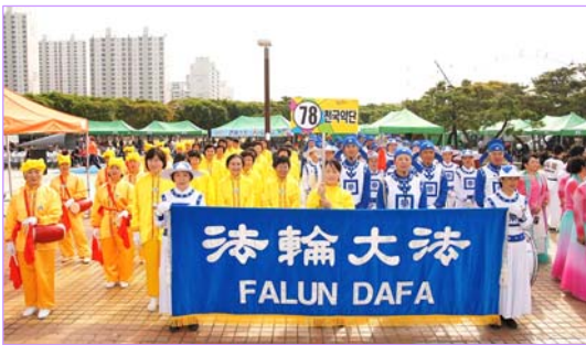
韩国富川庆典法轮功团体获嘉奖