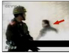
4、击打者仍保持用力姿势

不准在场内停留，没多考虑什么便在警察、便衣的驱赶下离开了广场。因为不知是咋回事，回去后几乎淡忘了。”