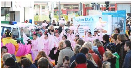
德国不来梅大游行法轮功团体获嘉奖

十二年来，法轮功在中国大陆受到全方位的迫害，而在世界 100 多个国家和地区却弘扬光大，这到底是为什么？