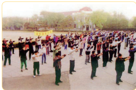
1999 年之前，部分清華大學法輪功學員在清華學堂前集體煉功

還有一位因患白血病而休學的碩士研究生，修煉法輪功短短兩個月，臉色變得紅潤，頭上長出又黑又密的頭髮；三個月後到醫院檢查，指標恢復正常了；半年後，他回到課堂，最終獲得碩士學位。在活生生的事實面前，他的父母也走入了法輪功修煉。