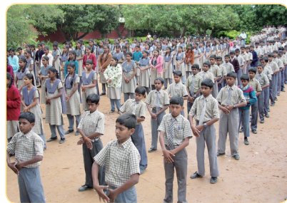
印度 Byreshawara 學校 學生集體煉功