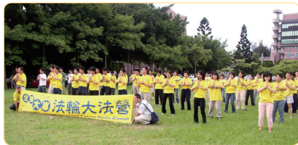
臺灣清華大學校園內的集體煉功

一個人相信什麼，本來是天賦的權利和自由，然而，同為清華，北京清華大學法輪功學員們卻沒有這麼幸運，他們不但不能自由地學煉法輪功，還要慘遭失學、身陷囹圄、被酷刑折磨甚至被剝奪性命的噩運。這究竟是為什麼，不能不令人深思。