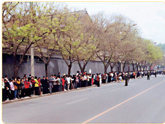
「四·二五」上訪現場，秩序井然

「四·二五」，法輪功首次引起全世界的關注，法輪功學員所表現出的和平理性和對正信的堅守，得到了國際社會的高度評價，稱此次上訪是「中國上訪史上規模最大、最理性平和、最圓滿的上訪」。「四·二五」當晚，江澤民出於妒忌，把和平上訪歪曲成「圍攻中南海」，並於1999年7月20日開始全面迫害法輪功。