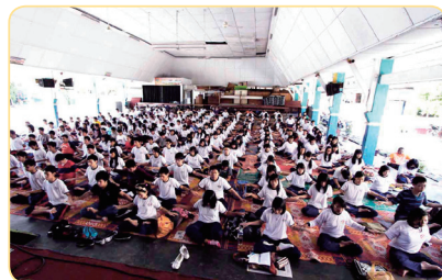
印尼蘇西天主教學校學生集體 學習法輪功

大家都感到震驚，問我吃了什麼靈丹妙藥。其實，我只是把「法輪大法好、真善忍好」種在了心裡，這九個字給了我一個善果。