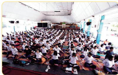
印尼苏西天主教学校学生集体 学习法轮功

大家都感到震惊，问我吃了什么灵丹妙药。其实，我只是把“法轮大法好、真善忍好”种在了心里，这九个字给了我一个善果。