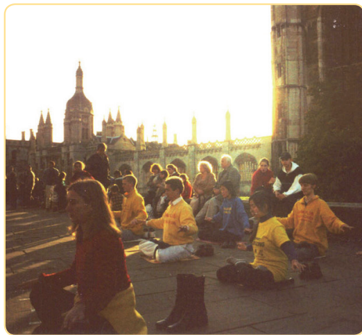
晨曦中，法轮功学员在国王学院楼前炼功

剑桥大学，这所有 800 多年历史的世界顶尖学府，曾经诞生了 87 位诺贝尔奖得主；如今，法轮功特有的清新纯正，正深深吸引着学风鼎盛的剑桥人。