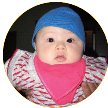
福娃六个月时的照片

今年过年回山东老家，归途中在高速公路洛阳段遇到几十辆车连环相撞的特大车祸，全家平安无事，再次见证了法轮大法的神奇，他们激动地喊出：谢谢大法师父！法轮大法好！真善忍好！