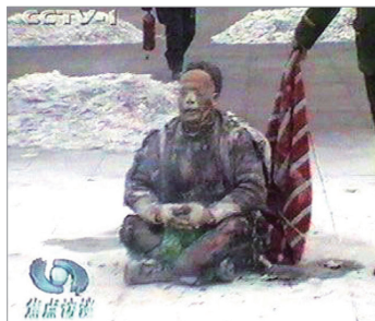
头发和塑胶瓶子烧不坏？

2001年8月14日，国际教育发展组织（IED）在联合国声明：我们的调查表明，“该事件是由这个政府一手导演的”。面对确凿证据，在场的中共代表哑口无言。该声明已被联合国备案。