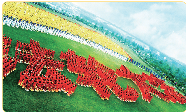
湖北武汉法轮功学员集体炼功 排列出“法轮大法”四个大字

由此，我主动了解法轮功，找《转法轮》看，真正明白了法轮功真相。现在我从心里认定了“法轮大法好、真善忍好”，还主动退出了中共党团组织。