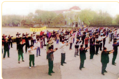
1999年之前，部分清华大学法轮功学员在清华学堂前集体炼功

还有一位因患白血病而休学的硕士研究生，修炼法轮功短短两个月，脸色变得红润，头上长出又黑又密的头发；三个月后到医院检查，指标恢复正常了；半年后，他回到课堂，最终获得硕士学位。在活生生的事实面前，他的父母也走入了法轮功修炼。