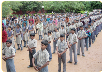
印度 Byreshawara 学校 学生集体炼功