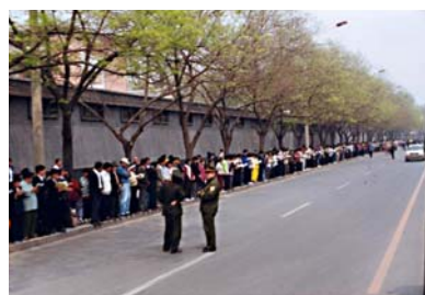
图：秩序井然的 4·25 上访民众

朱镕基大声问道：“你们到这来做什么呀？”站在门口的学员，从穿着举止看，大多是从京郊来的。刚听到问话，好象不知如何作答，没人吱