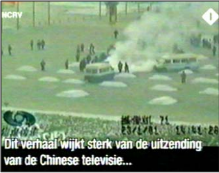
图：荷兰国家电视一台 2005 年 3 月 14 日《时事评论》专题播放法轮功节目，并揭露中央电视台“自焚”伪案，质疑两辆警车为何备有（据中共媒体报导）20 多个灭火器。

警察是不背着灭火器巡逻的，所谓“自焚”突发事件的当天，警察却在几分钟内从两辆警车里拿出 20 多个灭火器和灭火毯。