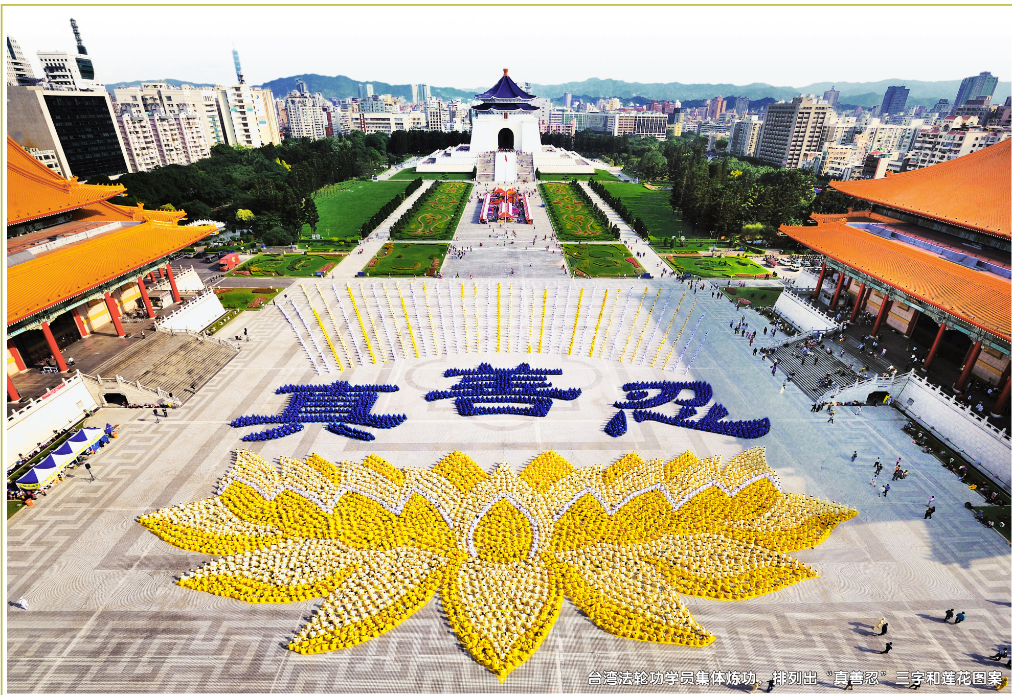
台湾法轮功学员集体炼功，排列出“真善忍”三字和莲花图案