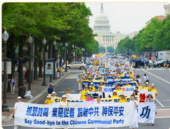
美国华盛顿民众声援退党大游行