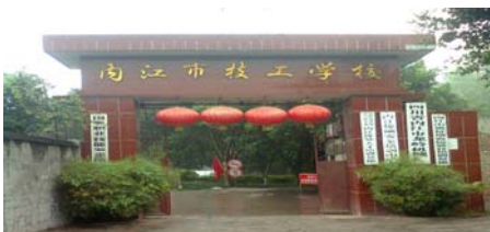
内江技工学校 (洗脑班) 大门