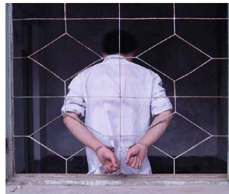
图：山东王村劳教所酷刑(演示图)：法轮功学员被关在劳教所小号里，铐在门上长达80多天。

2010年3月17日，多个人权组织在联合国日内瓦总部举行了关于中国问题的研讨会。会议题之一就是中共使用药物迫害法轮功学员。