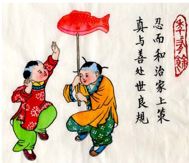
对联：真与善处世良规，忍而和治家上策 横批：年年有余