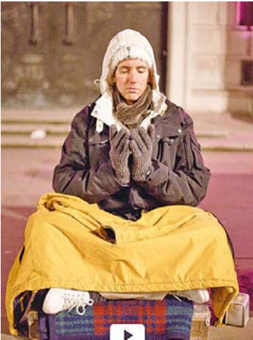
菲尔·歌勒拍摄的法轮功学员

菲尔·歌勒是一位住在伦敦的法国摄影师。今年 3 月 6 日至 7 日，他连续 24 小时跟踪拍摄了当日在领馆前的六位法轮功学员，每小时照一张。最后他把这二十四张照