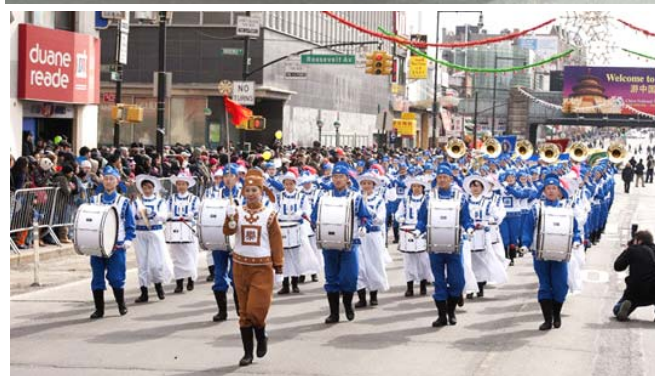
■ 纽约法轮功学员在法拉盛新年游行中展风采