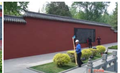
2006年5月2日拍摄(涂抹后)