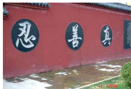
2006年1月26日拍摄(涂抹前)