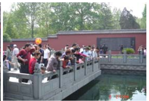
2006年5月2日拍摄(涂抹后)