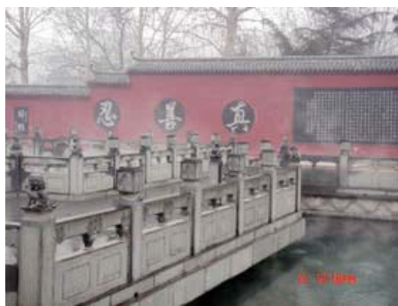
2005年11月2日拍摄(涂抹前)

与此同时，百脉泉、龙泉寺内的所有台阶，都用木板改铺成坡路，以备(据传)不能行走的江丑乘轮椅经过。