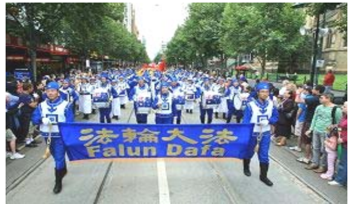
阵容庞大的天国乐团

【明慧网二零一一年一月二十八日】二零一一年一月二十六日是澳大利亚国庆节，每年的这一天墨尔本这个国际大都市里，来自不同族裔、不同社团的民众汇聚在市中心街头，共同庆祝这一天。各式各样的花车、乐队和代表各民间团体的特色表演队伍，多达 63 个团体，共 3000 人参加。游行在丰富多彩的各种国庆节庆祝活动中是最受欢迎的，身着各民族服饰的游行人群从最繁华的斯旺斯顿商业街一路载歌载舞，走至亚历山德拉公园。多姿多彩的游行队伍体现了澳大利亚多元、包容、自由的国民精神。