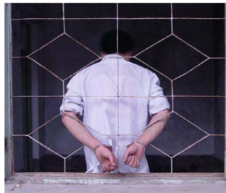
图：山东王村劳教所酷刑(演示图)：法轮功学员被关在劳教所小号里，铐在门上长达 80 多天。

2010 年 3 月 17 日，多个人权组织在联合国日内瓦总部举行了关于中国问题的研讨会。会议题之一就是中共使用药物迫害法轮功学员。