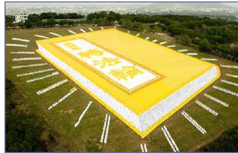
二零零九年十一月二十一日，亚洲法轮大法修炼心得交流会在台湾召开前夕，在台湾台中县外埔乡“台湾省农会休闲综合农场”面积达十公顷的青青草原，来自亚太国家约六千多名法轮功学员排组出巨幅《转法轮》书籍的立体画面。

法轮大法创始人及法轮功也因对人类、对社会强大的正面作用，在世界各国广受赞誉，至今法轮大法已经获得各国各地政府褒奖 1632 项，支持议案 313 件，支持信函 1154 个；至 2010 年，法轮大法已经传遍世界 100 多个国家和地区，法轮功的主要书籍《转法轮》被译为 30 多种语言在全世界发行，并可在互联网上免费下载。