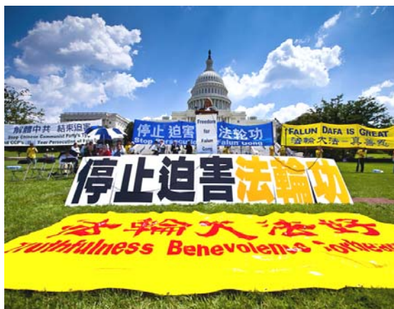
2010 年 7 月 22 日, 在美国首都华盛顿国会山庄西草坪上, 来自世界各地的三千多名法轮功学员举行了“七·二零”反迫害集会。

迫害法轮功的决定从一开始就在中央政治局常委内部引起争议。朱镕基、李瑞环认为, 对于一种“气功”完全没有必要大动干戈, 更没必要搞成巨大的运动。江