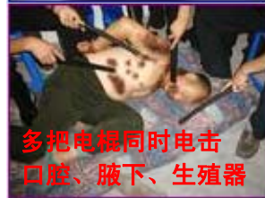
多把电棍同时电击 口腔、腋下、生殖器