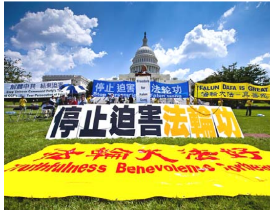
2010 年 7 月 22 日,在美国首都华盛顿国会山庄西草坪上,来自世界各地的三千多名法轮功学员举行了“七·二零”反迫害集会。

迫害法轮功的决定从一开始就在中央政治局常委内部引起争议。朱镕基、李瑞环认为,对于一种“气功”完全没有必要大动干戈,更没必要搞成巨大的运动。江