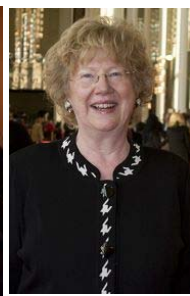
左图：美国联邦教育部长阿尼·邓肯偕夫人凯伦与子女观看神韵