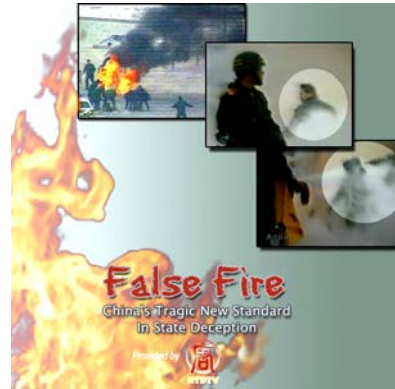
左图: 第 51 届哥伦布国际电影节获奖纪录片《伪火》 右图: 油画《梅里达的殉道士》, 12 岁的圣·尤拉莉亚试图抗议地方长官强制祭祀的要求(以示服从罗马皇帝), 被处死。当年的基督徒难道是在“搞政治”吗?

历史总是惊人地相似。两千年后, 江泽民集团和中共制造了震惊世界的天安门自焚骗局, 煽动仇恨, 以便进一步迫害法轮功。国际获奖纪录片《伪火》, 对中共的录像做慢镜头分析, 人们可以清楚地看到: 刘春玲是被现场的便衣击打致死; 所谓的自焚男子王进东, 浑身衣服被烧得七零八落, 可是他两腿