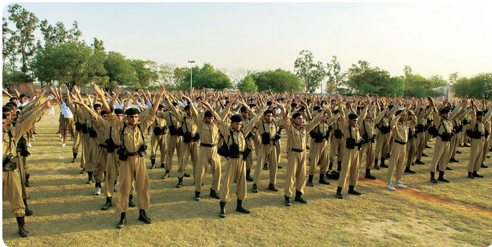
2009年4月13日，印度德里 (Delhi) 警察训练大学的上千学生学炼功法。

加拿大总理斯蒂文·哈珀 (Stephen Harper) 于2010年5月13日法轮大法日，再度给加拿大法轮大法学会发来贺信，赞扬法轮功学员与社会分享以“真、善、忍”理念为基础的修炼及传统。