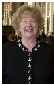
左图：美国联邦教育部长阿尼·邓肯偕夫人凯伦与子女观看神韵