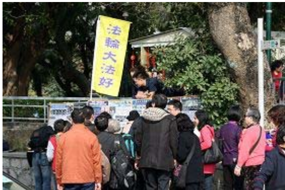
■在澳门大三巴景点上，游客在观看图片了解真相

二零一一年二月四日，正是中国新年大年初二，澳门法轮功学员利用假期除了在每天坚持的景点上讲真相劝三退（退出中共党、团、队）外，在市中心最热闹的地方——议事亭前又加开一个真相点。在两个景点上，特别是从中国大陆来的游客川流不息，人们在参观景点的同时，驻足观看图片，了解法轮功在中国大陆无辜遭受迫害的真相。在退党义工的帮助下，不少人办了三退。