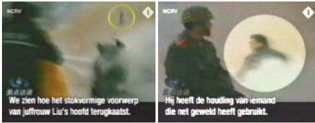
图：2005 年 3 月 14 日，荷兰国家电视台播放“天安门自焚”真相。“时事评论”说，法轮功自 1992 年公开传出后一度风靡全中国，吸引了近七千万人学炼，该数字超过了中共党员数目，因此被中共视为一大威胁，于 1999 年予以禁止并迫害。节目中，评论员以播放“天安门自焚”现场的录像为真凭实据，指出“自焚”是伪造的。（左：刘春玲被重物击倒 右：凶手）

中华文化讲善恶有报。中共残忍地制造和掩盖自焚骗局，在害别人的同时，何尝不是在自毁。而那些仍在参与迫害的人，更应珍惜自己的生命、悬崖勒马、赎回自己的未来。