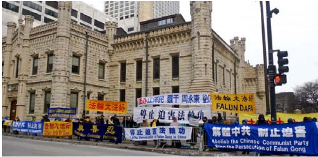
图：中共党魁胡锦涛于1月20日下午由美国首都华盛顿抵达芝加哥访问，再次遇到呼吁良知的人群的夹道相“迎”。法轮功学员打出“法办江泽民、罗干、刘京、周永康”、“停止迫害法轮功”、“法轮大法好”等中英文横幅，以无声胜有声的平和方式，表达内心的呼声。

2010年3月16日，美国国会众议院在国会大厦投票，以412票赞成1票反对，通过了第605号决议案。美国议员在议案中对过去十年来因为个人信仰而遭受中共持续迫害的法轮功学员及其家人表示同情，要求立即结束中共对法轮功学员的迫害，释放所有被关押的法轮功学员。