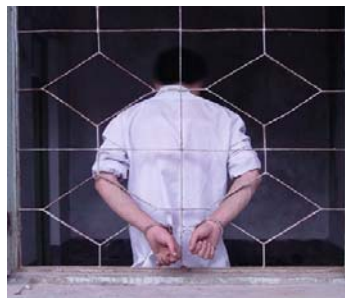
山东王村劳教所酷刑(演示图)：法轮功学员被关在小号里，铐在门上 80 多天。