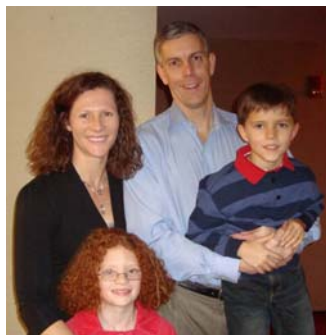
上图：前国防部长威廉·科恩和夫人洁内特 下图：美国联邦教育部长阿尼·邓肯偕夫人凯伦与子女观看神韵