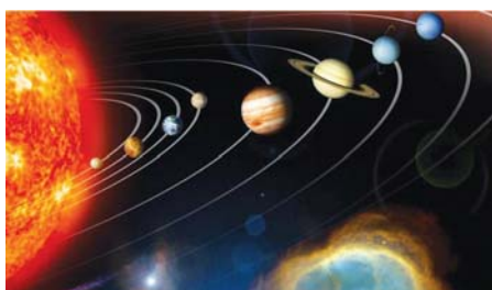
图：精美的太阳系是偶然形成的吗

牛顿说：“这个美丽无比的太阳、行星和彗星的体系，只能借助一位全能的、明智而有权威的全能者计划而存在。这位全能者永远不灭，无所不在。”