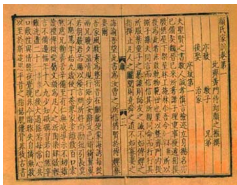
图：元刻本《颜氏家训》