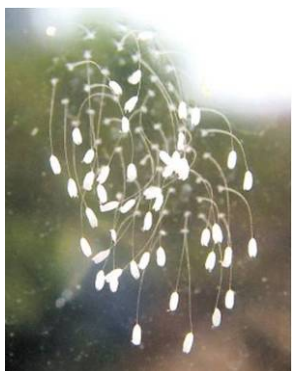
■2008年10月，青岛市一家公司的办公室玻璃上盛开了47朵优昙婆罗花。《青岛日报》做了相关报导。

再说说不同国家、不同朝代的预言吧！我国三国时期诸葛亮的《马前课》；明朝刘伯温的《烧饼歌》；