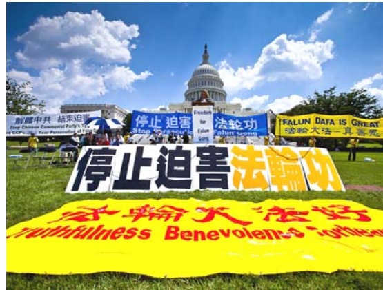
2010 年 7 月 22 日, 在美国首都华盛顿国会山庄西草坪上, 来自世界各地的三千多名法轮功学员举行了“七·二零”反迫害集会。

部引起争议。朱镕基、李瑞环认为, 对于一种“气功”完全没有必要大动干戈, 更没必要搞成巨大的运动。江泽民还在自己的家里遇到了反对, 因为他的妻子王冶坪、孙子江志成都曾经修炼过法轮功。但江泽民坚持己见, 出于妒忌和极端的权力欲, 强压政治局通过了镇压的决议。