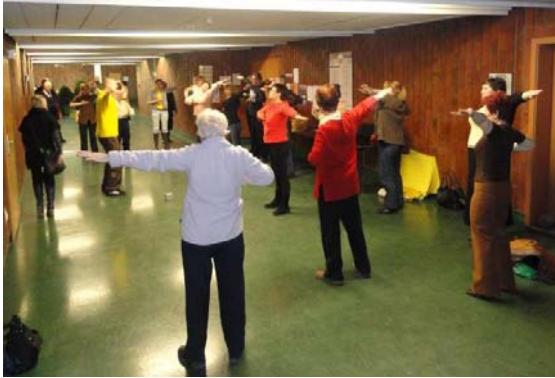
左图：三天的博览会期间，一批批的人们不间断地来学炼法轮功 右图：人们纷纷来到展位前了解法轮大法