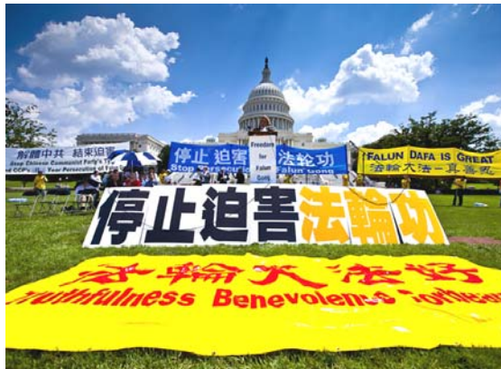
2010 年 7 月 22 日,在美国首都华盛顿国会山庄西草坪上,来自世界各地的三千多名法轮功学员举行了“七·二零”反迫害集会。

【明慧网】香港《前哨》杂志 2011 年 2 月刊大陆报导栏目中的头条文章,即总第 240 期被列为封面的精选文章,作者揭示了中共前党魁江泽民的自认告白,文章题目是《江泽民终生后悔的两大事件》。江泽民自知死期不远,2010 年起至少两次对身边的人谈到,这一辈子做过两件愚蠢之事:蠢事之一是美国轰炸南斯拉夫时,下令中国大使馆不能撤退;蠢事之二则是镇压法轮功。江泽民镇压法轮功,为自己平添了几千万“敌人”,这是他自己认为一辈子中所做的第二件大蠢事。