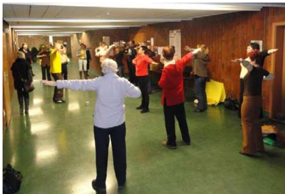
左图: 三天的博览会期间, 一批批的人们不间断地来学炼法轮功 右图: 人们纷纷来到展位前了解法轮大法