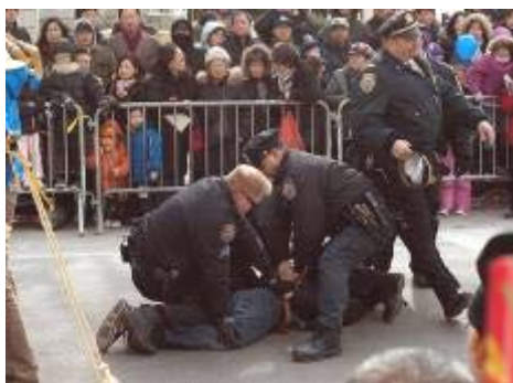
图: 在纽约法拉盛新年游行中, 一华裔男子冲到法轮功队伍的前面, 拉扯横幅并折断横杆, 被三位警察制服并逮捕。

法轮功在美国是受法律保护的信仰团体, 不仅如此, 因为法轮功基于“真、善、忍”的普世价值,