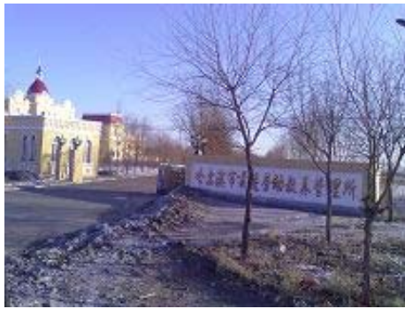
哈尔滨市前进教养院

劳教所狱警隔一段时间就进行所谓的安全检查,搜身,所有衣裤、鞋子全脱,所有物品、食品柜、床铺无一幸免;过年、过节更甚,搜完后屋内一片狼藉,再强迫收拾。为了应付上级的检查,几天几天的反复搞卫生,买一些新的盆子、香皂、毛巾等用品放在床下摆样子,从来不许使用。晚上睡觉前卫生间的门全部上锁,不管多少人都把尿桶放在室内,满屋子的尿桶味,大便也不给开卫生间。全天二十四小时监控,晚上从来不熄灯。