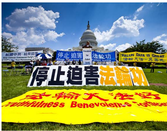
2010 年 7 月 22 日，在美国首都华盛顿国会山庄西草坪上，来自世界各地的三千多名法轮功学员举行了“七·二零”反迫害集会。

迫害法轮功的决定从一开始就在中央政治局内部引起争议。朱镕基、李瑞环认为，对于一种“气功”完全没有必要大动干戈，更没必要搞成巨大的运动。江泽民还在自