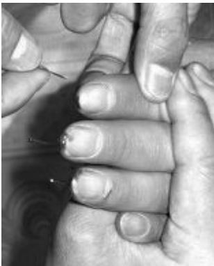
酷刑演示图：十指插针