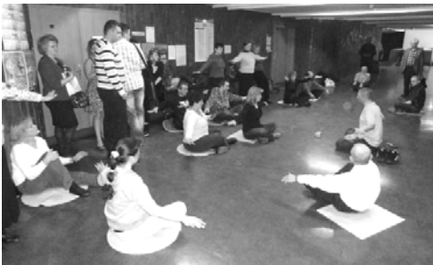
三天的博览会期间，一批批的人们不间断地来学炼法轮功

在征签簿上签名支持法轮功。四十本波兰文《转法轮》被现场民众抢购一空，连学员自己的《转法轮》也被渴望了解法轮功的有缘人请走。