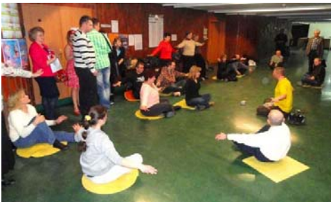
三天的博览会期间，一批批的人们不间断地来学炼法轮功

在征签簿上签名支持法轮功，四十本波兰文《转法轮》被现场民众抢购一空，连学员自己的《转法轮》也被渴望了解法轮功的有缘人请走。