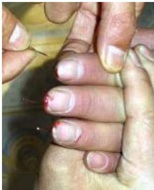
酷刑演示图：十指插针