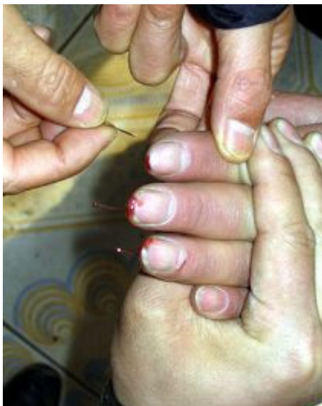
图:酷刑演示:针扎手指

谓的“震撼教育”:用三、四根电棍长时间电击法轮功学员。在这种流氓手段的威逼、欺骗高压下,一些人被放不下的执著和在监狱生出的怕心带动,违心的向邪恶妥协,写了不修炼保证。接着恶警实施第二步“熔炉效应”:把所有邪悟和新妥协的集中起来,天天所谓的座谈交流经验,最后使邪悟者越来越邪,断章取义的找掩盖自己执著的借口,给自己开脱。