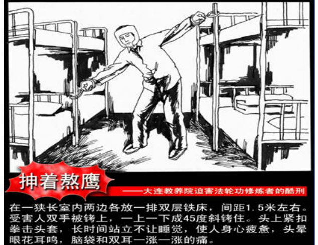
图：大连教养院迫害法轮功修炼者的酷刑—— 伸着熬鹰