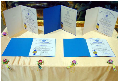
上图, 法轮功学员向麻省理工学院的学生(右)讲真相。下图, 麻州州务卿、参议员、众议员颁发的对法轮大法创始人和法轮大法的褒奖。