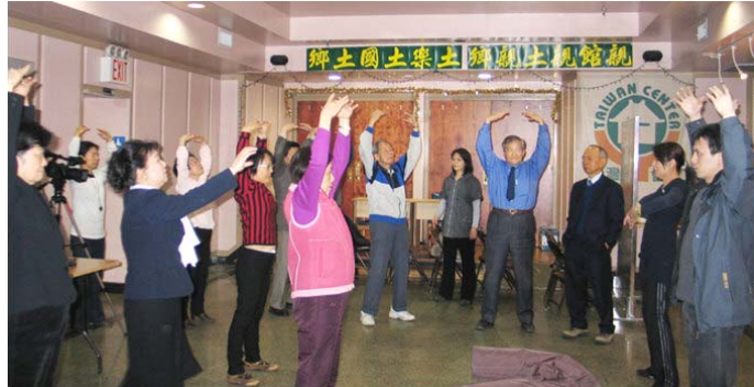
图：法轮功学员在台湾馆内教授法轮功的功法

她自己寻思着，那些一直炼法轮功的人个个身体都棒棒的，看来什么教也不行了，只有学法轮功才会有希