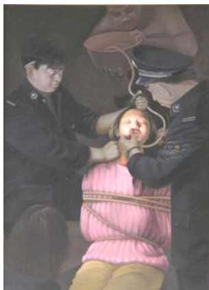
← 酷刑示意图：野蛮灌食。 中共监狱、劳教所等恶警常用野蛮灌食酷刑方式摧残法轮功学员。

食，六、七个犯人把我从炕上拖到地上，按住我的胳膊、腿，压住我前胸，撮住我头发，拧住我鼻子不让我喘气，然后用牙刷狠命撬我牙齿，往我嘴里灌玉米糊糊，折腾半天没灌进去，她们才松开我。