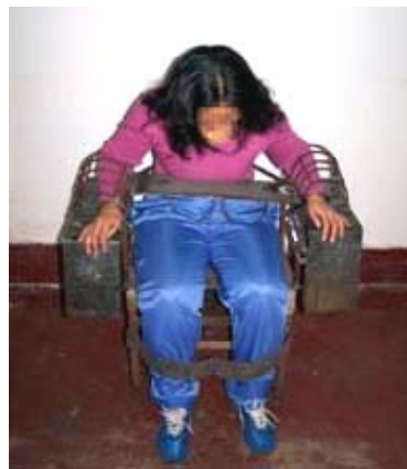
酷刑演示： 绑在铁椅子上

第二天上午几个警察要非法做笔录，并按他们意思给我照相，被我拒绝后，他们威胁我。下午把我绑架到了青岛大山看守所非法关押。