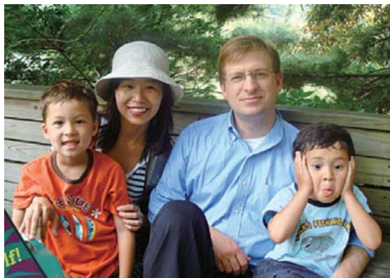
图：布罗迪与太太和两个儿子