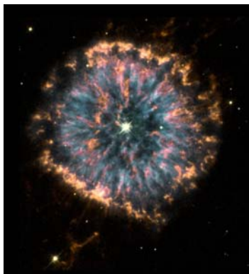
图：《科学》杂志的这篇文章中提到，“细胞组织与宇宙结构存在着惊人的相似”。图为哈勃太空望远镜拍摄到的遥远星云照片，这张照片被称为“天体之眼”。

问题的解决有些出乎意料，美国麻省的一个医疗工作者建议尝试一下他所在部门研制的分析磁共振成像等数据的医学电脑软件。