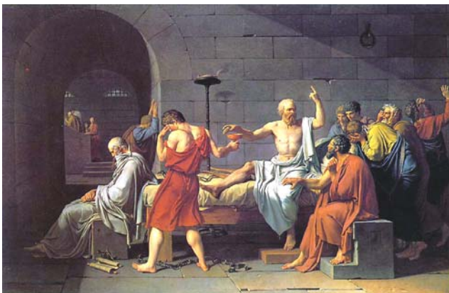
公元前 399 年，在雅典监狱中讲哲理的苏格拉底。