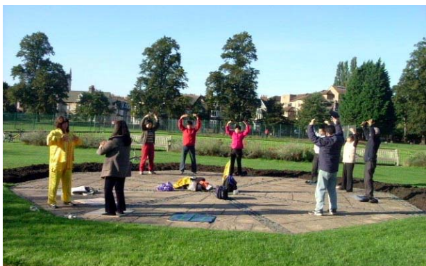
图：在剑桥大学公园里晨炼