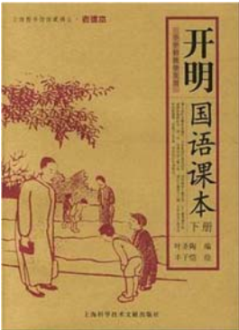
图：1949 年前此课本被印 40 余版次

很多专家及媒体评论，民国教材第一课教你学做人。今天的课本充满人造味儿，学生被洗脑了。