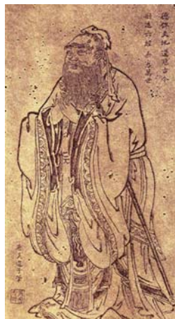
图：先师孔子行教像（唐·吴道子）