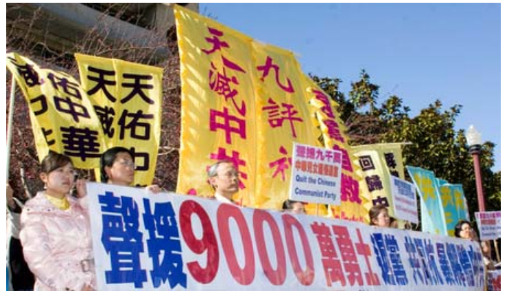
图：美国旧金山举办声援九千万三退大潮游行集会

在西方，也有圣人教导让人不要随便起誓的文化。如在《马太福音》中，耶稣教导人们不能随便发誓，以防被恶人利用去做坏事。东西方的圣哲们，对“誓”的