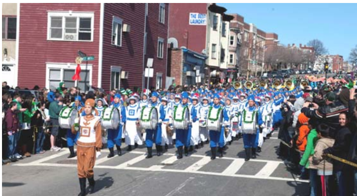
图：天国乐团英姿飒爽，展现中华风采

法轮功游行队伍首先是精神抖擞的法轮功学员举着“法轮大法”横幅，而后是气势磅礴的天国乐团、弘扬大法美好的横幅队、最后是受人喜爱的舞龙队。