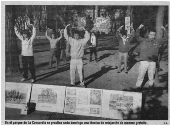
图：西班牙瓦德拉哈勒最大的报纸《Nueva Alcarria》对法轮功炼功点的报道图片

动作简单，但能量场却非常强大。在瓦德拉哈拉市中心的公园里，每周日上午十二点会有很多人来这里炼功，有两位教功人在这里义务教授功法，来这里炼功的人每个人都能感受到身体和心灵的提升。”报道还说，“不管是老人、小孩、新或老学员，每个人都会很方便地接触和了解法轮功，来公园炼功的人从二十到六十岁的都有。教功人之