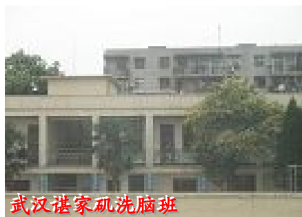
武汉谏家矶洗脑班