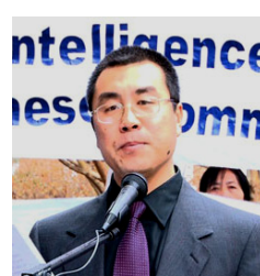
前国安部对外情报 官 李凤智