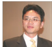
前驻悉尼外交官 陈用林