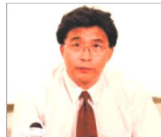
前沈阳市司法局 局长 韩广生