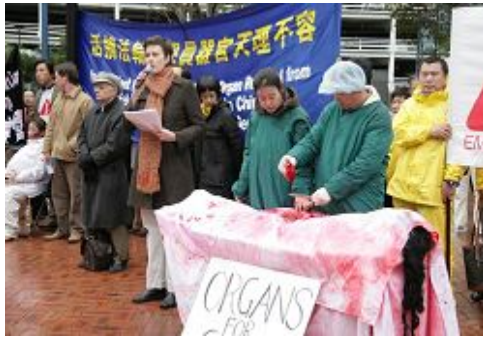
■揭露中共活摘法轮功学员器官的模拟展示

【明慧网】第二十二届国际器官移植医生大会于二零零八年八月十日在悉尼召开，来自各个国家的四千多名医生、专家和学者云集悉尼。法轮功学员于八月十日中午，在达