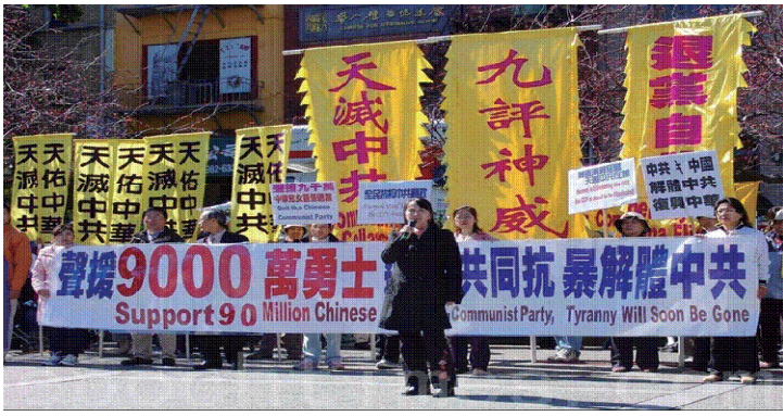
图：2011年2月27日各界人士在旧金山举行游行集会，声援国内外九千万勇士加入三退的历史大潮。多位人士在集会上发言，呼吁还没有退出中共组织的人，抓住时机，赶紧退出中共，为自己选择光明的未来。