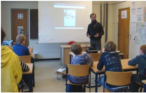
在学校的课堂上介绍法轮功