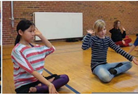
孩子们专注地学炼法轮功

（明慧记者舒慧丹麦报道）座落在丹麦日德兰半岛西部的海宁市（Herning）的 Hammerum Friskole 学校举办中国专题周，给学生讲授中国文化、传统。二零一一年二月九日，校方邀请法轮功学员前往介绍法轮功。