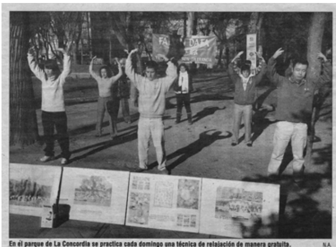
图：西班牙瓦德拉哈勒最大的报纸《Nueva Alcarria》对法轮功炼功点的报道图片

动作简单，但能量场却非常强大。在瓦德拉哈拉市中心的公园里，每周日上午十二点会有很多人来这里炼功，有两位教功人在这里义务教授功法，来这里炼功的人每个人都能感受到身体和心灵的提升。”报道还说，“不管是老人、小孩、新或老学员，每个人都会很方便地接触和了解法轮功，来公园炼功的人从二十到六十岁的都有。教功人之