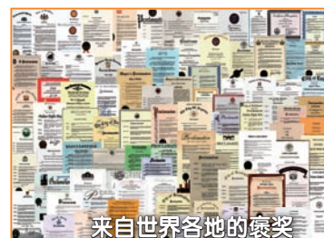
来自世界各地的褒奖

1992年~1999年，法轮功传遍神州大地。“真、善、忍”法理使亿万修炼者身心净化、道德升华。1998年，国家体育总局组织北京、武汉、大连及广东省的医学界专家，对3万多名法轮功学员做了五次医学调查，表明法轮功祛病健身有效率高于98%，学员心理状况也得到极大改善。同时，以乔石为首的老干部也做了详尽的调查，得出“法轮功于国于民有百利而无一害”的结论，并向中央做了书面汇报。