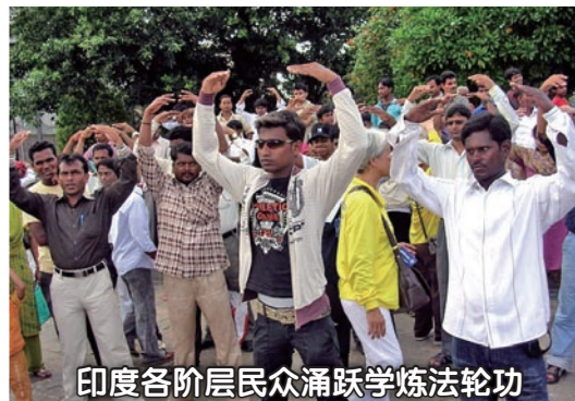
印度各阶层民众踊跃学炼法轮功