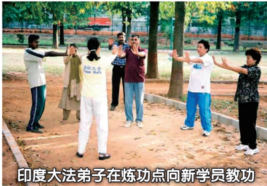
印度大法弟子在炼功点向新学员教功