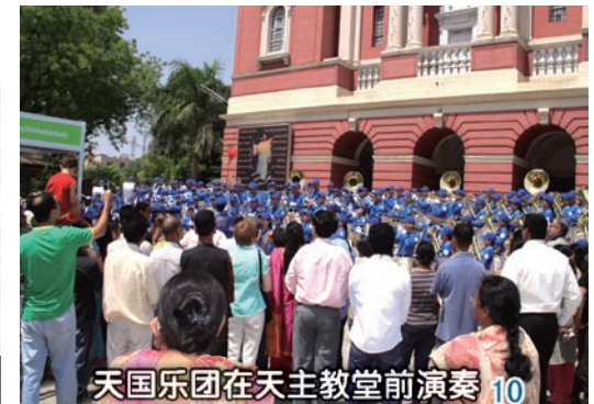
天国乐团在天主教堂前演奏 10