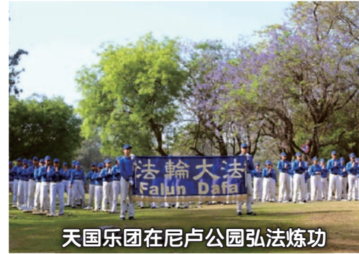
天国乐团在尼卢公园弘法炼功