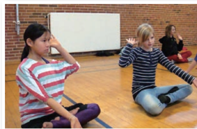
P05 法轮功走入丹麦课堂