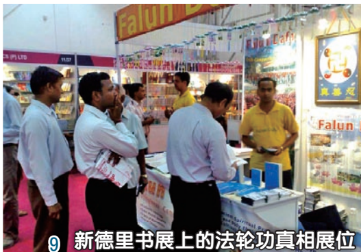
新德里书展上的法轮功真相展位