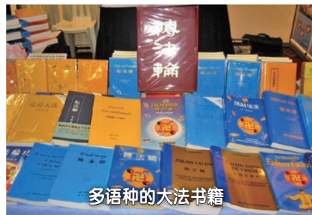
多语种的大法书籍

1993年北京东方健康博览会授予法轮功最高奖：“边缘科学进步奖”，李洪志先生获“受群众欢迎气功师”称号，还被公安部官方致信感谢；1997年12月《医药保健报》报道：“祛病健身首选法轮