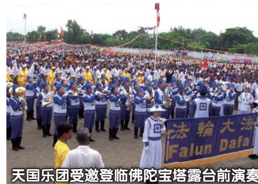
天国乐团受邀登临佛陀宝塔露台前演奏