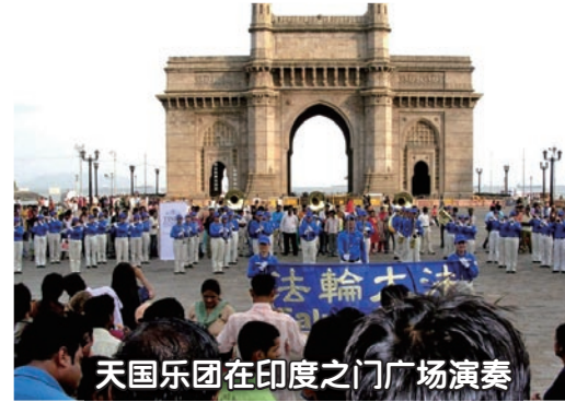
天国乐团在印度之门广场演奏