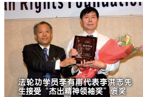
法轮功学员李有甫代表李洪志先生接受“杰出精神领袖奖”褒奖

2009年9月26日，亚太人权基金会将“杰出精神领袖奖”授予法轮功创始人李洪志先生，赞扬“真、善、忍”对净化人类的灵魂有着巨大的作用。