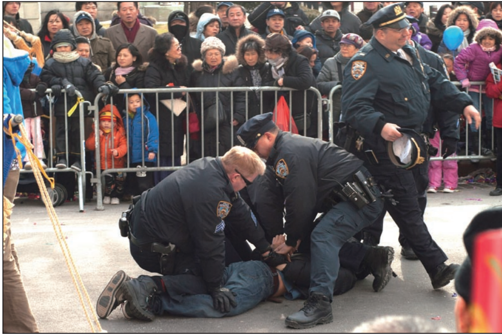
法拉盛新年游行活动中，一华裔男子从观众群中冲到法轮功队伍的前面，拉扯横幅并折断横杆。三个警察立即冲上去将其制服并逮捕。

一年一度的法拉盛中国新年游行于二零一一年二月十二日在纽约皇后区法拉盛登场，街头人头攒动，充满了喜庆气氛。压轴的法轮功队伍阵容多姿多彩，深受欢迎。但在游行进行约一个小时后，一华裔男子暴力骚扰法轮功游行队伍，被警察当场逮捕后押送至警局。