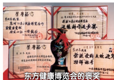
东方健康博览会的褒奖