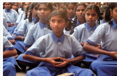
P07 法轮大法弘传印度