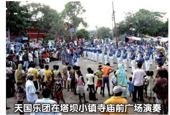
天国乐团在塔坝小镇寺庙前广场演奏