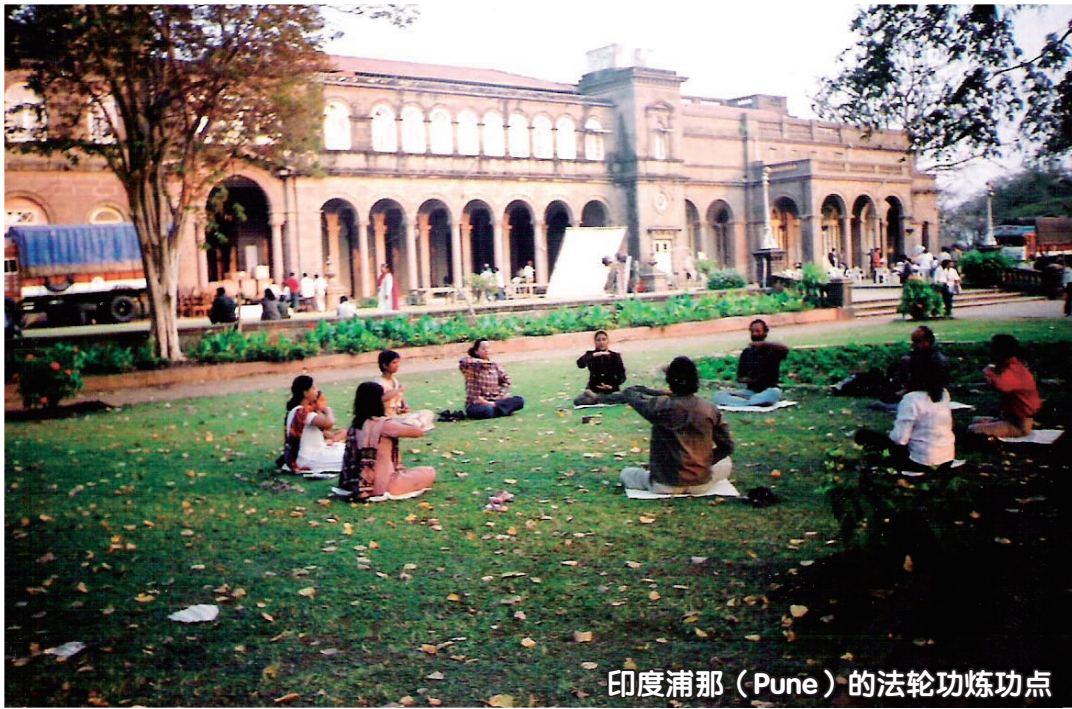
印度浦那 (Pune) 的法轮功炼功点

2009年4月12日，亚太天国乐团到印度首都德里弘扬法轮功，把法轮大法的福音带到北印度。