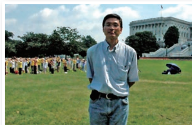
P11 美太空署高工为何反迫害