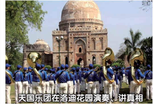
天国乐团在洛迪花园演奏、讲真相