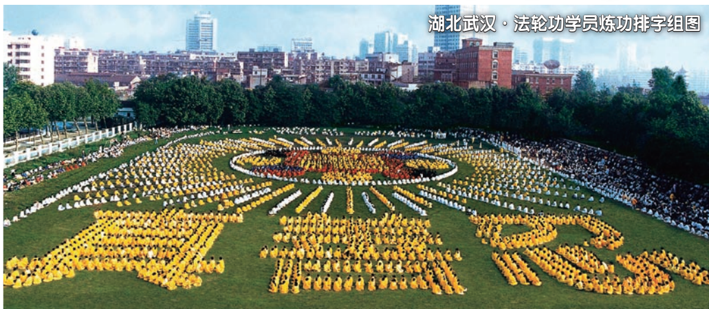
湖北武汉·法轮功学员炼功排字组图

法轮大法（又称法轮功）是由李洪志先生创编的佛家上乘修炼大法，同化宇宙最高特性“真、善、忍”，按照宇宙演化原理修炼，修的是大法大道。李洪志先生用人类最浅白的语言，讲出了宇宙间最精深的道理。