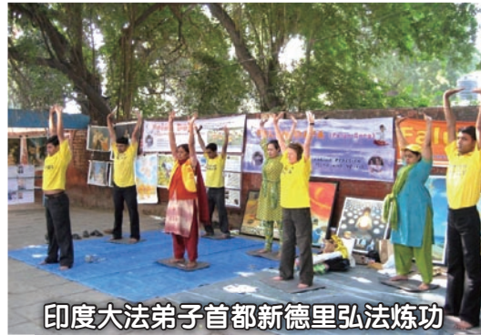
印度大法弟子首都新德里弘法炼功