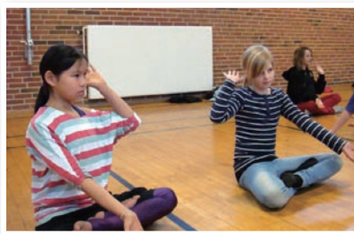
P09 法轮功走入丹麦课堂