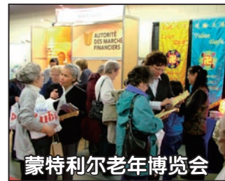
蒙特利尔老年博览会