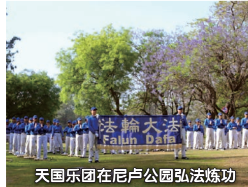
天国乐团在尼卢公园弘法炼功