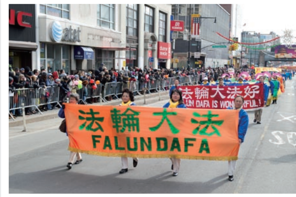
纽约法轮功学员在法拉盛新年游行中展风采

最后是风姿飒爽的腰鼓队，小小腰鼓传递着济世的福音，给法拉盛辛卯年新年的游行划上了圆满的句号，给人们带去了美好的希望和祝福。