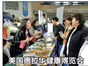
美国德拉华健康博览会