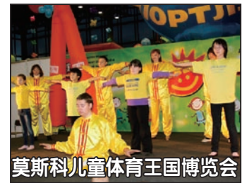
莫斯科儿童体育王国博览会