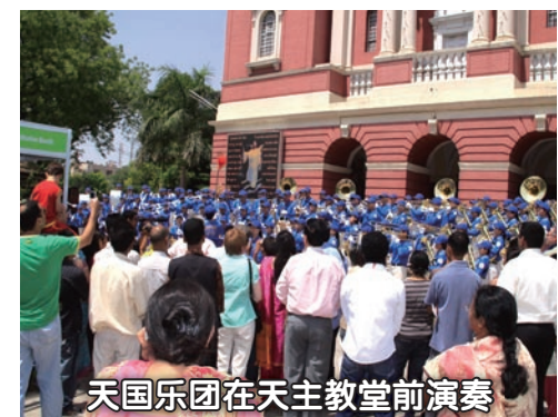
天国乐团在天主教堂前演奏