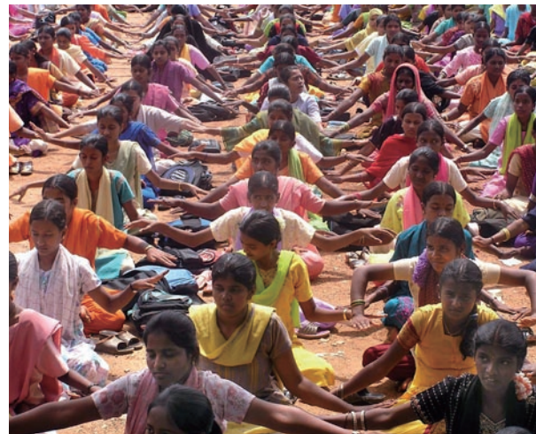
印度公立女子学校全体一千二百名学生学功