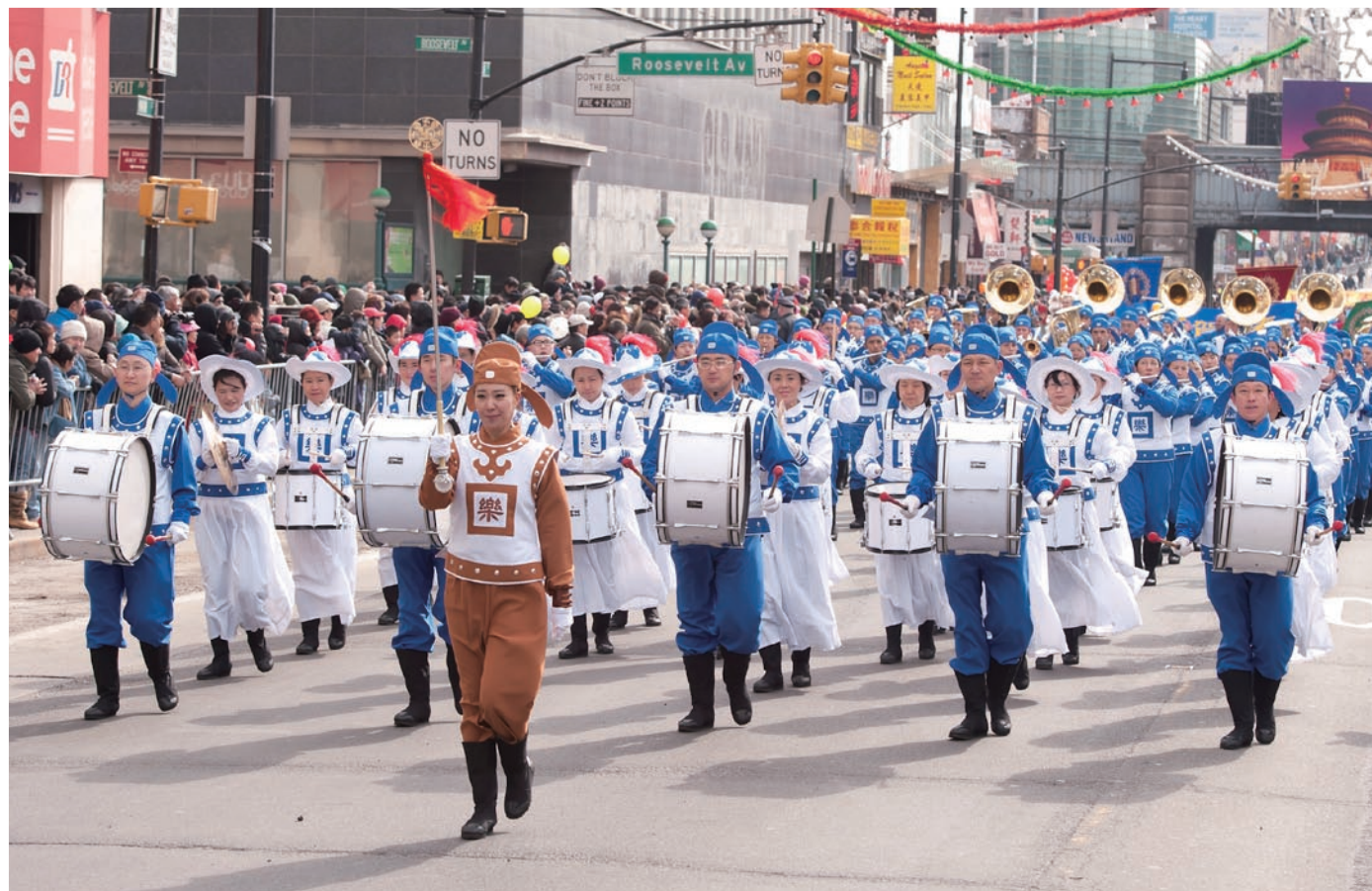
身着古装的天国乐团让人耳目一新，壮美的乐曲，传递着光明和希望

2011年2月12日，纽约法拉盛的街头人头攒动，街道两旁的人行道挤满了前来观看兔年游行的人群。压轴的法轮功队伍阵容多姿多彩，色彩明亮缤纷，赢得众多镜头的对焦，把游行推向了高潮。