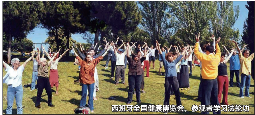
西班牙全国健康博览会，参观者学习法轮功