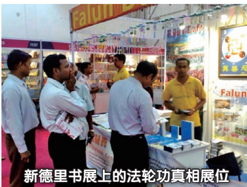
新德里书展上的法轮功真相展位