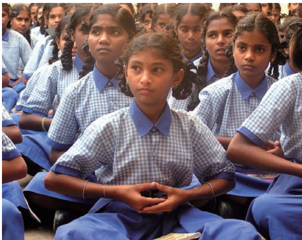
大法正在印度成千上万的学生中迅速传播

向其他校长介绍自己和全校师生学炼法轮功后的巨大变化，引起了与会校长们的高度关注，随后有60所学校邀请法轮功学员到校去教功。如今，班加罗尔市就有80多所大中小学的师生修炼法轮功。法轮功不但作为学校体育课的内容，大法著作《转法轮》中的《论语》还被纳入学校英文教材的卷首。法轮大法正在印度成千上万的学生中迅速传播。