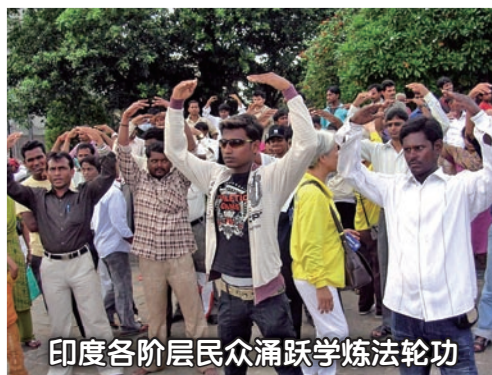
印度各阶层民众踊跃学炼法轮功