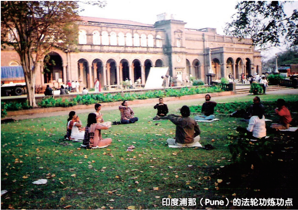
印度浦那 (Pune) 的法轮功炼功点

2009年4月12日，亚太天国乐团到印度首都德里弘扬法轮功，把法轮大法的福音带到了北印度。