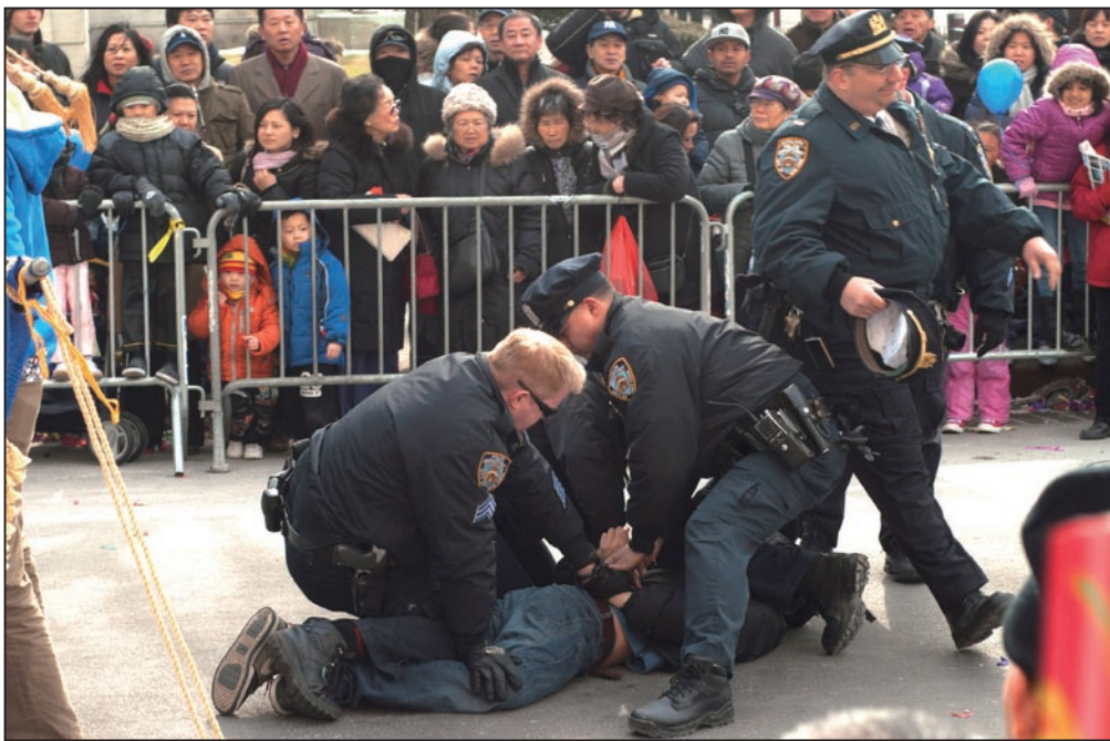
法拉盛新年游行活动中，一华裔男子从观众群中冲到法轮功队伍的前面，拉扯横幅并折断横杆。三个警察立即冲上去将其制服并逮捕。

一年一度的法拉盛中国新年游行于二零一一年二月十二日在纽约皇后区法拉盛登场，街头人头攒动，充满了喜庆气氛。压轴的法轮功队伍阵容多姿多彩，深受欢迎。但在游行进行约一个多小时后，一华裔男子暴力骚扰法轮功游行队伍，被警察当场逮捕后押送至警局。