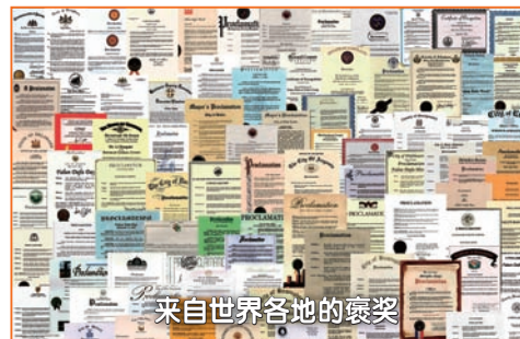
来自世界各地的褒奖

“法轮大法周”和“法轮大法日”等形式表示支持。至今已经获得各界褒奖1632项，支持议案313件，支持信函1154封，这彰显着大法超越民族和时空的巨大威德与感召力。