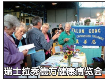
瑞士拉秀德方健康博览会