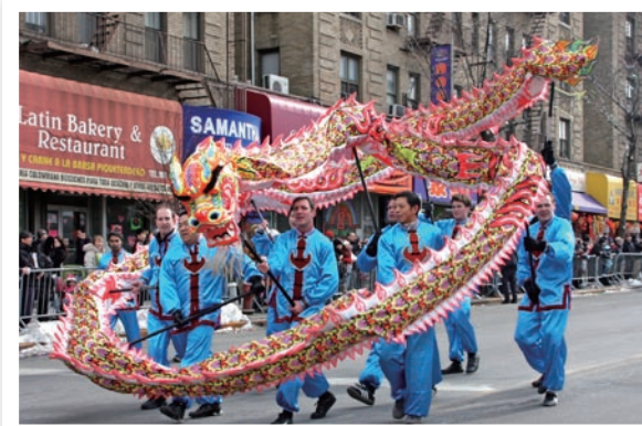
金龙飞舞，舞龙队深深吸引了路边的观众