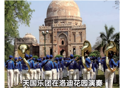
天国乐团在洛迪花园演奏