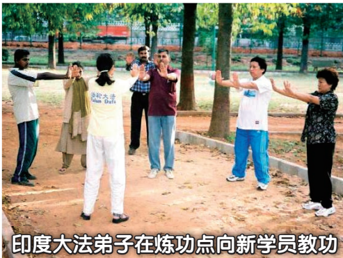
印度大法弟子在炼功点向新学员教功