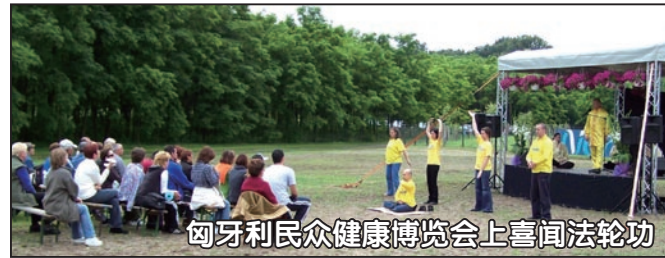
匈牙利民众健康博览会上喜闻法轮功