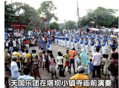
天国乐团在塔坝小镇寺庙前演奏