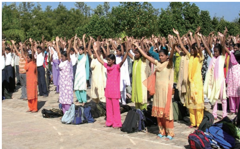
Sri Adichunchanagiri Mahasamsthama moth学校的学生学炼法轮功