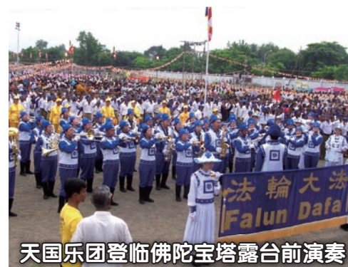
天国乐团登临佛陀宝塔露台前演奏