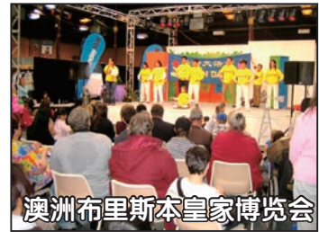
澳洲布里斯本皇家博览会