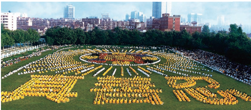
湖北武汉·法轮功学员炼功排字组图

法轮大法（又称法轮功）是由李洪志先生创编的佛家上乘修炼大法，同化宇宙最高特性“真、善、忍”，按照宇宙演化原理修炼，修的是大法大道。李洪志先生用人类最浅白的语言，讲出了宇宙间最精深的道理。