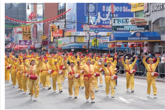
风姿飒爽的腰鼓队传递着济世的福音