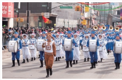
P05 法轮功纽约法拉盛游行