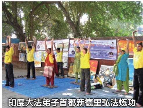
印度大法弟子首都新德里弘法炼功