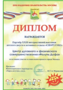
法轮功团体在莫斯科儿童健康博览会获奖