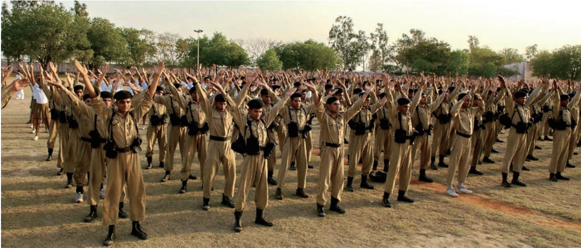
2009年4月13日，印度首都德里（Delhi）警察训练大学的上千学生集体学炼法轮功法，一片祥和之气洋溢警察学校