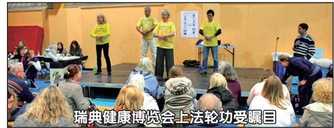
瑞典健康博览会上法轮功受瞩目