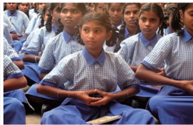
P11 法轮大法弘传印度